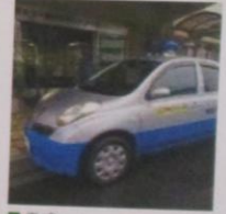
青/白/地域を見守ります