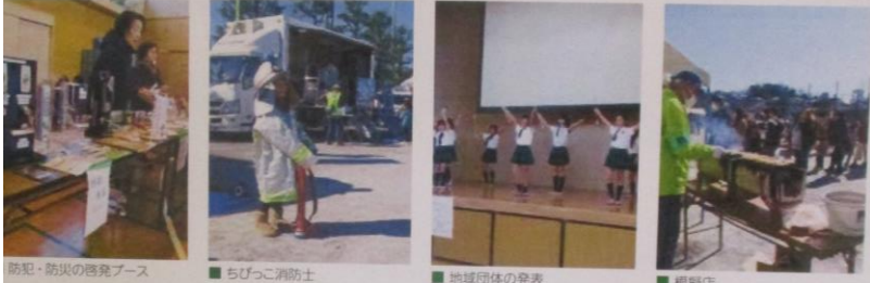
防犯・防災の啓発ブース ■ちびっこ消防士 ■地域団体の発表 ■模擬店

組合まつり—防犯・防災フェスティバル— (約1,000名来場) ぐるみで取り組む防犯・防災活動。世代を超えて自由に参加・体験、楽しく学べる場 (会場:豊田中学校)