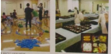
サロンはなだて 世代間交流 (プラレール遊び) ■なでしこ食事サービス 高齢者会食の弁当作り